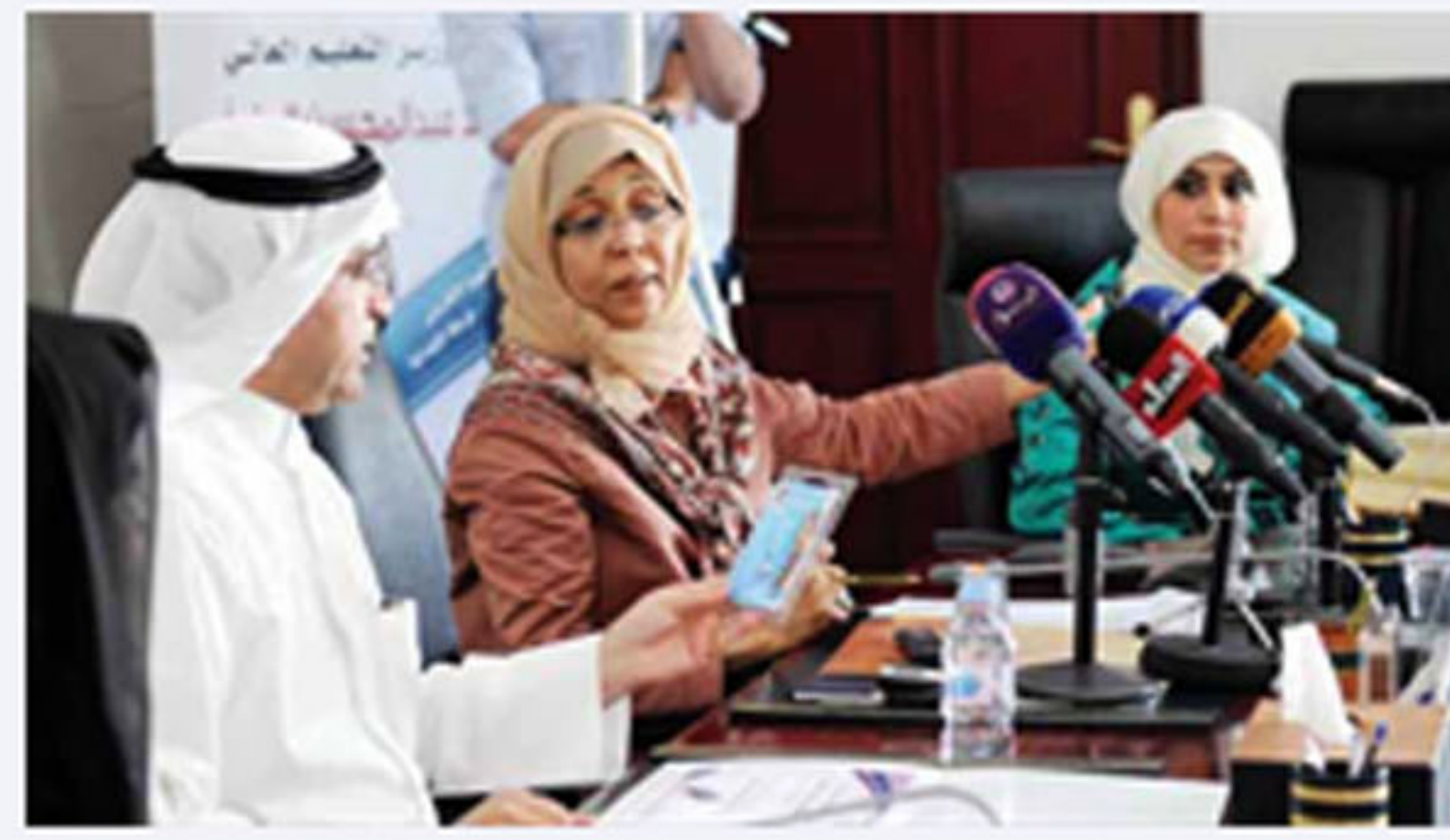
المليفي يستعرض الفلاش ميموري.. ويدت الوتيد والشراح

لؤي شعبان اعلن وزير التربية وزير التعليم العالي احمد المليفي عن بداية حقبة جديدة في مسيرة التعليم في البلاد، مع انتهاء الوزارة من تنفيذ مشروع الفلاش ميموري، معتبرا ان المشروع يمهد لبداية الدخول التدريجي نحو مرحلة التعليم الالكتروني. وحدد المليفي الايام القليلة المقبلة موعدا لتوزيع الفلاش على طلبة المرحلة، وقبل عطلة عيد الاضحى المبارك، منوها باهمية المشروع الذي يعد الاول من نوعه على مستوى المنطقة العربية لما له من اثر فعال ومباشر في الانتقال بالتعليم من التقليدية الى عالم التكنولوجيا والالكترونيات وتحويل المهنة الى عمل سام ممتع تشوبه الاثارة والتشويق.